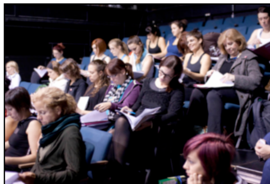
Journées de Formation 2011 de l'AQEDÉ.